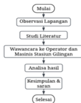
Gambar 1. Struktur alur penelitian

Penelitian praktik kerja lapangan ini dilakukan selama dua bulan di PT. X, kegiatan ini dilaksanakan pada tanggal 1 September sampai dengan 31 Oktober. Pada kegiatan kali ini penulis berfokus pada salah satu bagian pada Stasiun Gilingan, yaitu pada salah satu alat yang sangat penting pada pemrosesan tebu menjadi nira. Alat ini yaitu cane carrier berfungsi membawa tebu menuju ke alat kerja pendahuluan. Pada magang kali ini penulis menggunakan beberapa metode seperti :Observasi lapangan