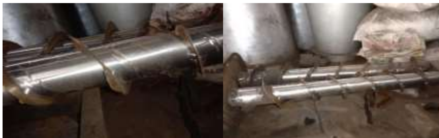
Gambar 3. Breakdown Maintenance

Breakdown maintenance merupakan strategi perawatan yang sangat kasar dan kurang baik karena dapat menimbulkan biaya tinggi, kondisi mesin atau komponen tidak diketahui dan tidak adanya perencanaan waktu tenaga kerja maupun biaya yang baik . Kemudian perawatan mesin berkembang dengan sistem preventive maintenance. Preventive maintenance bertujuan untuk mencegah kerusakan mesin yang sifatnya mendadak dan meningkatkan reliability mesin.