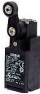
Gambar 2 C. Limit Switch

Limit switch pada mesin potong polar Mohr berfungsi untuk membatasi pergerakan pisau potong atau mengatur posisi awal dan akhir pemotongan. Ini membantu mencegah kerusakan pada mesin dan memastikan operasi mesin berlangsung dalam batas yang aman, meningkatkan keselamatan dan konsistensi proses pemotongan.