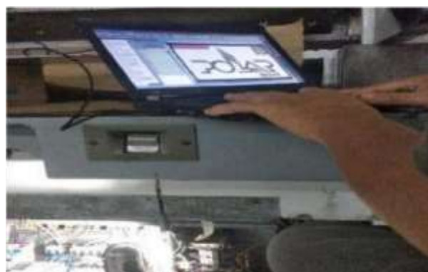
Gambar 3.C. proses program PLC