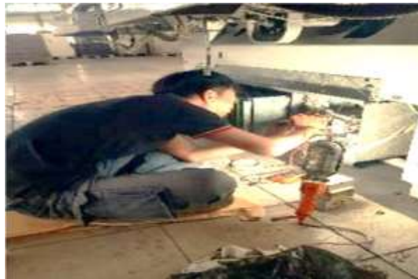
Gambar 3 B. Proses Perbaikan Mesin Polar