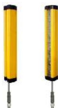
Gambar 2A. Sensor Light Barrier

Light Barrier pada mesin potong polar berfungsi untuk mendeteksi keberadaan objek, seperti tangan operator, dalam area berbahaya selama operasi. Ketika cahaya terhalang, mesin otomatis menghentikan atau mengurangi operasinya untuk mencegah cedera atau kerusakan. Ini adalah langkah keselamatan penting pada mesin potong untuk melindungi operator dan peralatan.