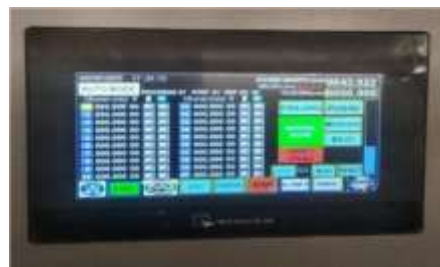
Gambar 4. Layar HMI

Layar HMI di atas terdapat tombol-tombol yang berfungsi untuk mengoperasikan jalannya mesin. :