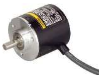
Gambar 2 B. encoder

Light Barrier pada mesin potong polar berfungsi untuk mendeteksi keberadaan objek, seperti tangan operator, dalam area berbahaya selama operasi. Ketika cahaya terhalang, mesin otomatis menghentikan atau mengurangi operasinya untuk mencegah cedera atau kerusakan. Ini adalah langkah keselamatan penting pada mesin potong untuk melindungi operator dan peralatan.