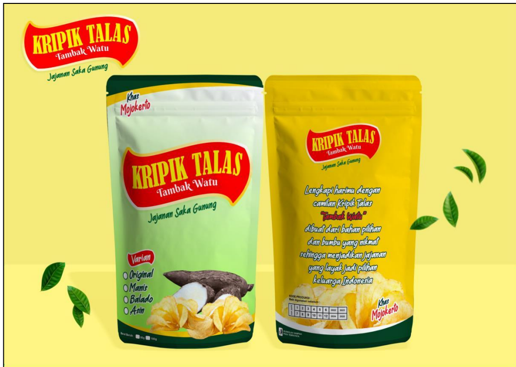
Gambar 4.10 Desain Kemasan Kripik Talas hasil Kansei