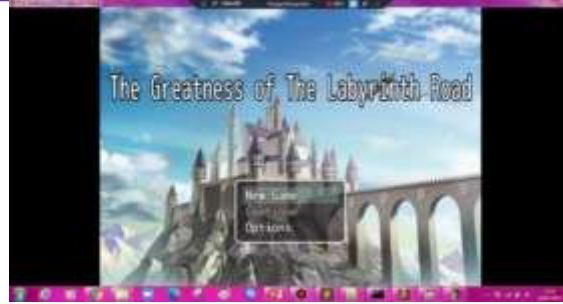
Gambar 4. Tampilan Main Menu