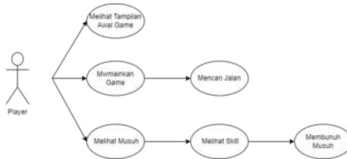
Gambar 2. Diagram Use Case Game

Seperti yang ditunjukkan pada Gambar 2 merupakan contoh use case diagram pada game RPG “ The Greatness of The Labyrinth Road ”, adapun penjelasannya sebagai berikut: