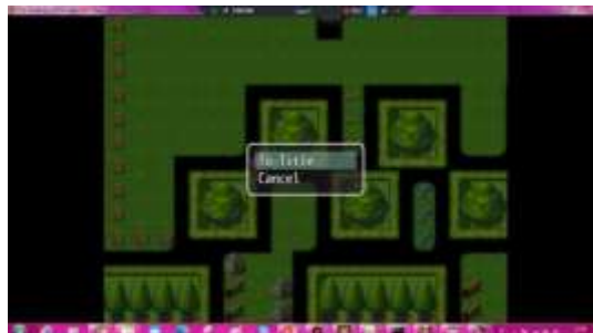
Gambar 6. Tampilan Quit Menu

Menu Quit merupakan menu untuk keluar dari game. Dalam menu ini terdapat dua pilihan yaitu To Title dan Cancel. Rancangan Menu Quit dapat dilihat pada Gambar 6.