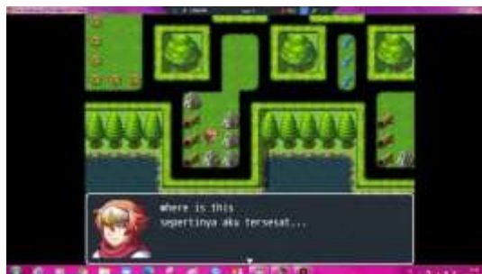
Gambar 7. Tampilan MV Awal

MV awal adalah tempat dimana player awal akan muncul. Dalam tampilan MV ini akan ada percakapanyang dimana akan disediakan clue untuk melanjutkan ke beberapa level.