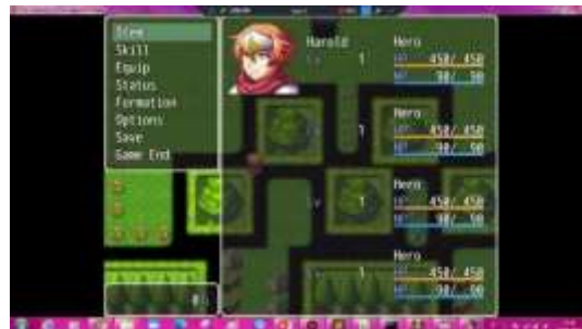
Gambar 5. Tampilan Pause Menu

Pause Menu terdapat 8 pilihan, yaitu Item, Skill, Equip, Status, Formation, Options, Save dan Game End. Rancangan dari Pause Menu dapat dilihat pada Gambar 5.